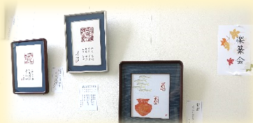
昨年の作品展示写真