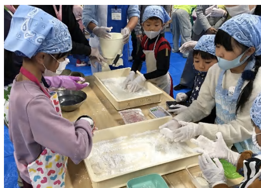
粉をつけておもちを丸めていきます。粉が飛び散らないように気をつけて。