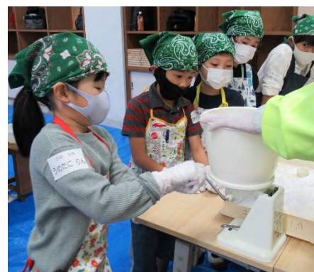
つきあがったおもちを切り分ける「まる餅くん」。ハンドルを回すと下からおもちが出てきます。