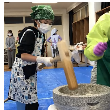
リズムよくついていきます