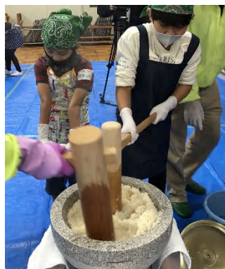
蒸し上がったもち米を杵でつぶします