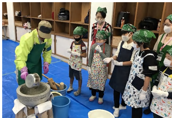
臼にお湯を張って温めておきます。子どもたちは真剣に見ています

協力して下さった「酒味湯の会」のみなさん、「健康推進員」のみなさん、「青少年育成区民会議」のみなさん、ありがとうございました。