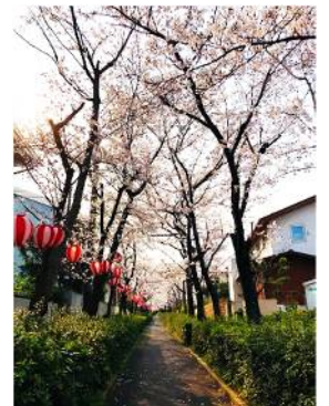
↑毎年恒例！桜まつり