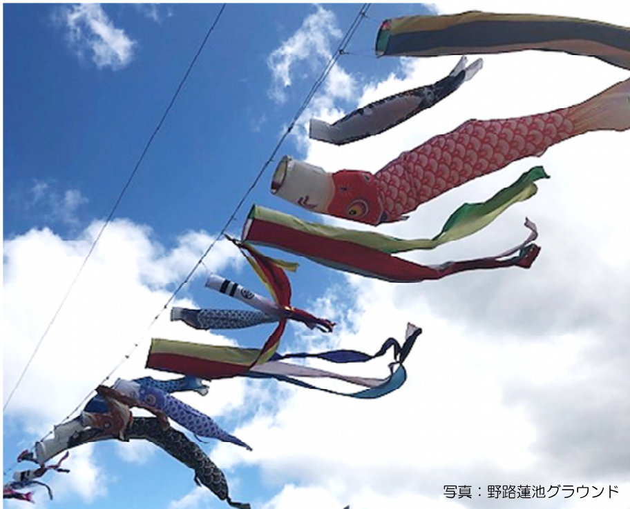
写真：野路蓮池グラウンド