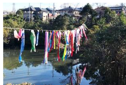
↑こいのぼり遊泳作戦！

「一人はみんなのために、みんなは一人のために」を町内会のスローガンに、お互いのコミュニケーションを深めるために様々な企画を今年度も実施していきます。