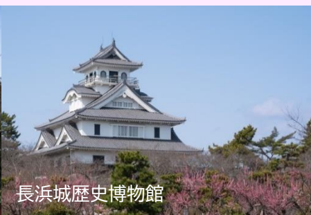
長浜城歴史博物館