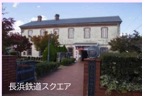
長浜鉄道スクエア