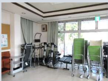
器具などで大会議室の後方がいっぱい！