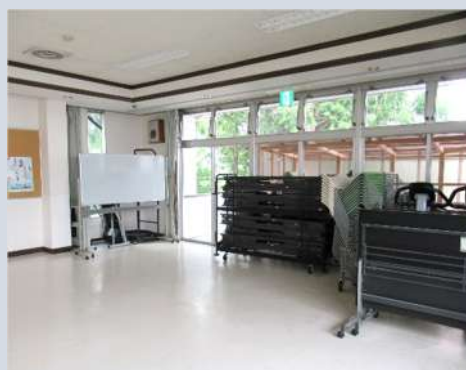
器具等を倉庫に収納し、後方がすっきり！