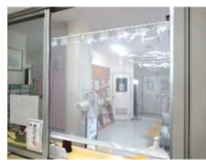
←飛沫感染防止対策として、窓口や職員のデスク間をビニールで間仕切りしています。