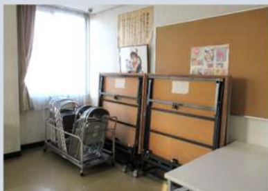
長年使用していない備品で手狭な研修室