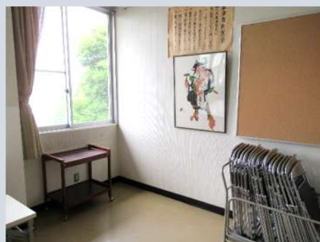
広々と使用していただけるようになりました。