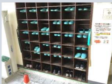
木が傷み、暗かった玄関。