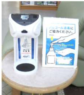
↑自動手指消毒器を設置