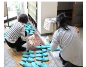
↑使用後のスリッパは、除菌をしています。