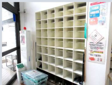
白に塗り替え、玄関が明るく♪