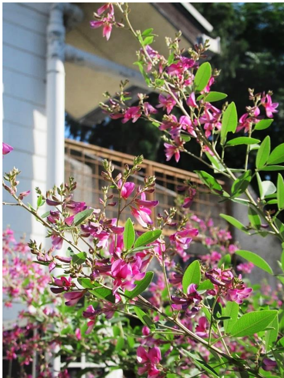
(写真:玉川まちづくりセンター裏庭)

QRコードをカメラ付携帯電話で読み取っていただくと、貸室予定情報などをご確認いただけます。