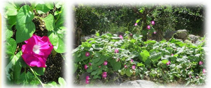
(写真:10/26 玉川まちづくりセンター裏庭)