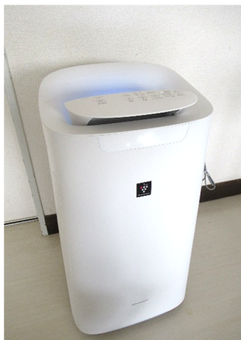
シャープ空気清浄機【加湿機能付】 (空清31量まで)