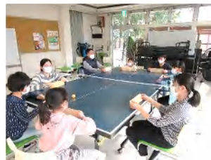
ニュースポーツ体験会

参加してくださった方は、 みなさんコロナ感染拡大防止 策をとりなが らも、楽しん でおられま した。