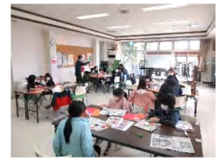
ペーパークラフトづくり