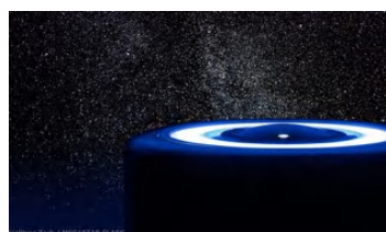
満点の星空を！プラネタリウム