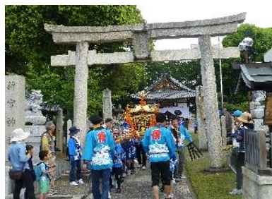
平成30年5月3日の様子