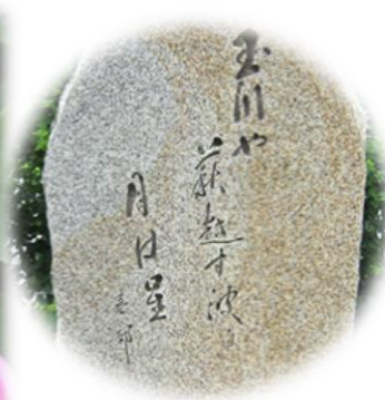
↑玉川まちづくりセンター 駐車場にある石碑

玉川や萩越す波に月は星 春 郊 秋の夜長、月の光が燦爛と降り注ぐ野路の玉川よ。両岸から川面に一様に萩の花が枝を垂らし、ゆれていく。その萩の花を波が越えていく。その波の川面は月光が映えて、まるでたくさんと輝いてなんと美しいことか。