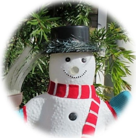
玉川学区の クリスマス

今年度の学区内での行事・イベントも残すところあとわずか！ 「戌年」が間もなく終わります。これから迎える「亥年」がよき年になりますように！