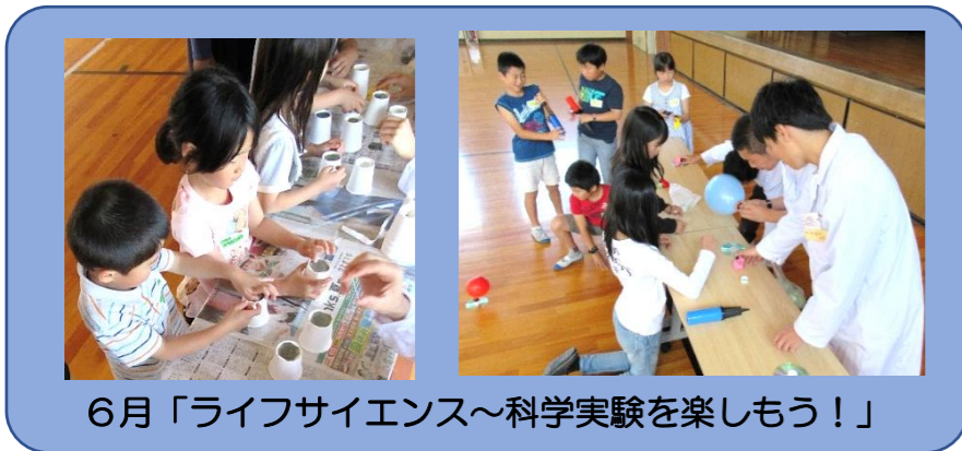
6月「ライフサイエンス～科学実験を楽しもう！」