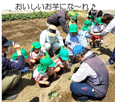
おいしいお芋にな〜れ♪