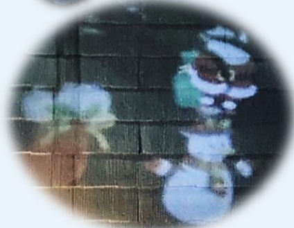
プロジェクションマッピング