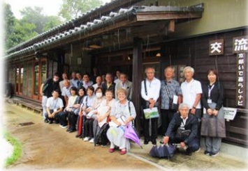
先進地研修 (井手町)