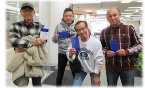
チーム戦1位: 体育振興会